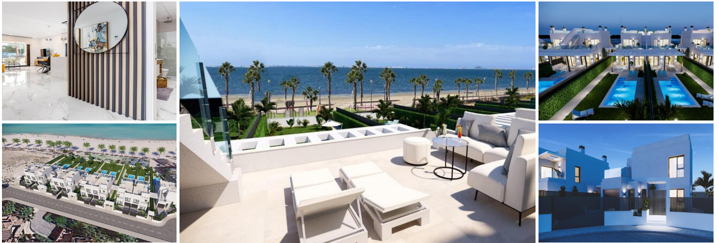
Luxuriöse Neubauvillen am Wasser in Los Alcázares

Entdecken Sie das ultimative mediterrane Leben mit diesem exklusiven Wohnprojekt, das neun moderne Villen direkt am Wasser in der wunderschönen Küstenstadt Los Alcázares in Murcia umfasst. Die Villen befinden sich in der begehrten Gegend Nueva Ribera und sind auf Luxus, Privatsphäre und Bequemlichkeit ausgelegt. Golfplätze, Einkaufszentren und Verkehrsknotenpunkte sind von hier aus bequem zu erreichen. Jede Villa bietet eine hochwertige Ausstattung, einen atemberaubenden Meerblick und einen privaten Pool und ist damit die ideale Wahl für alle, die einen modernen Rückzugsort an der Küste suchen.