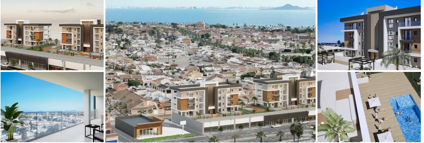
Touristische Wohnungen mit Mietlizenz in Los Narejos, Los Alcázares