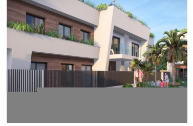
Neubau Häuser in Torre-Pacheco, Costa Cálida