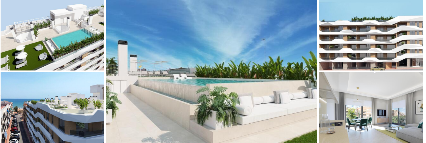
NEUBAU WOHNUNGEN IN GUARDAMAR DEL SEGURA

Neubau von Wohnungen und Penthäusern in Guardamar del Segura.