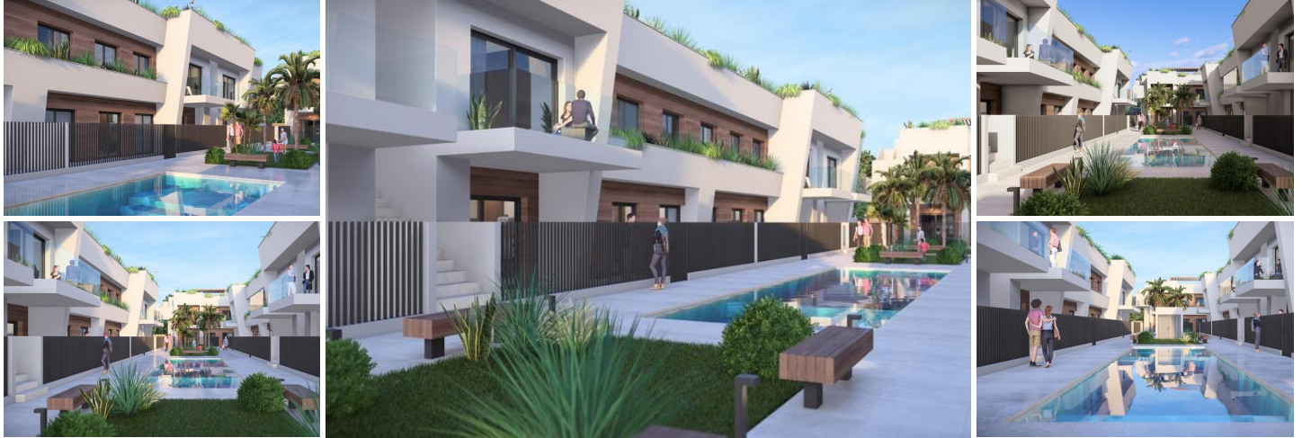
Neubau Häuser in Torre-Pacheco, Costa Cálida