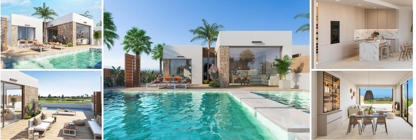
Neu gebaute Villen in Los Alcazares

Los Alcázares ist ein idyllischer Ort für diejenigen, die in eine neue Wohnimmobilie an der Costa Cálida investieren möchten. Nur 25 Minuten vom Flughafen Murcia und ca. 55 Minuten vom Flughafen Alicante entfernt, ist diese Gegend über die Autobahn bequem mit den großen Städten wie Cartagena, Murcia und Alicante sowie mit anderen schönen Stränden an der Costa Cálida und der Costa Blanca verbunden.