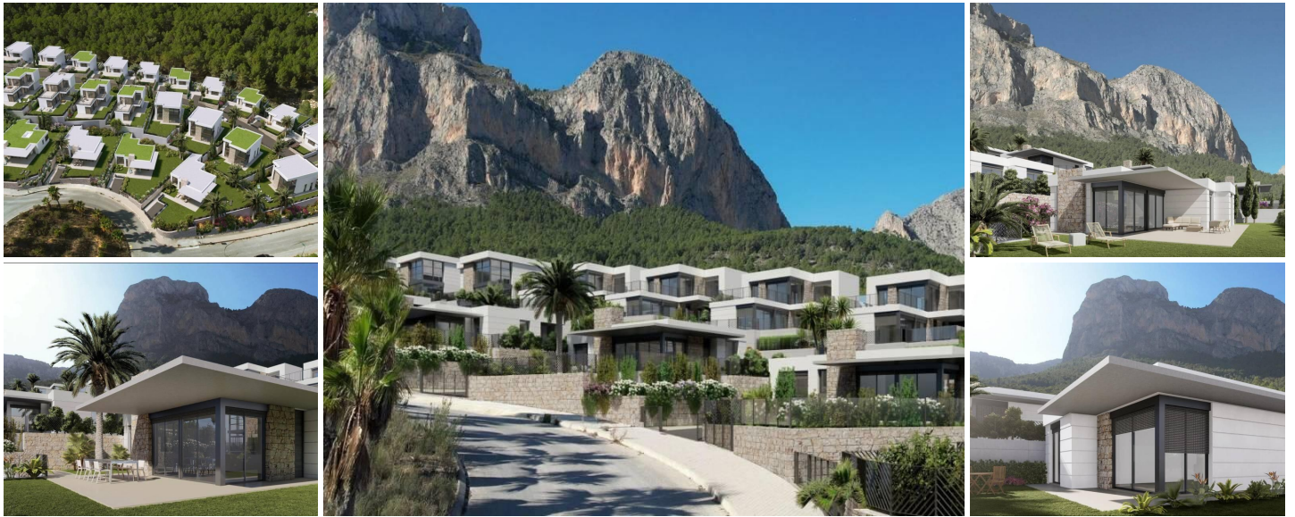
Neubau Villen in Polop, Alicante