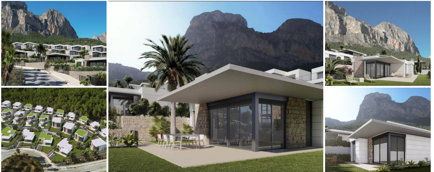
Neubau Villen in Polop, Alicante