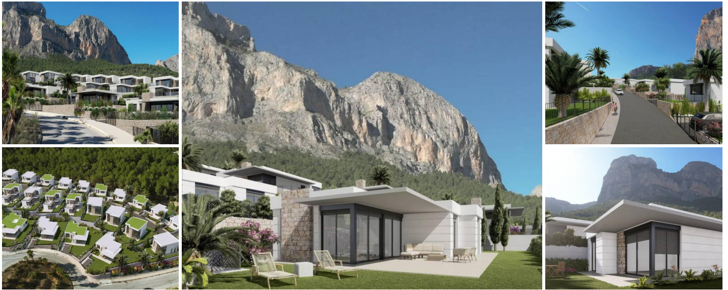
Neubau Villen in Polop, Alicante