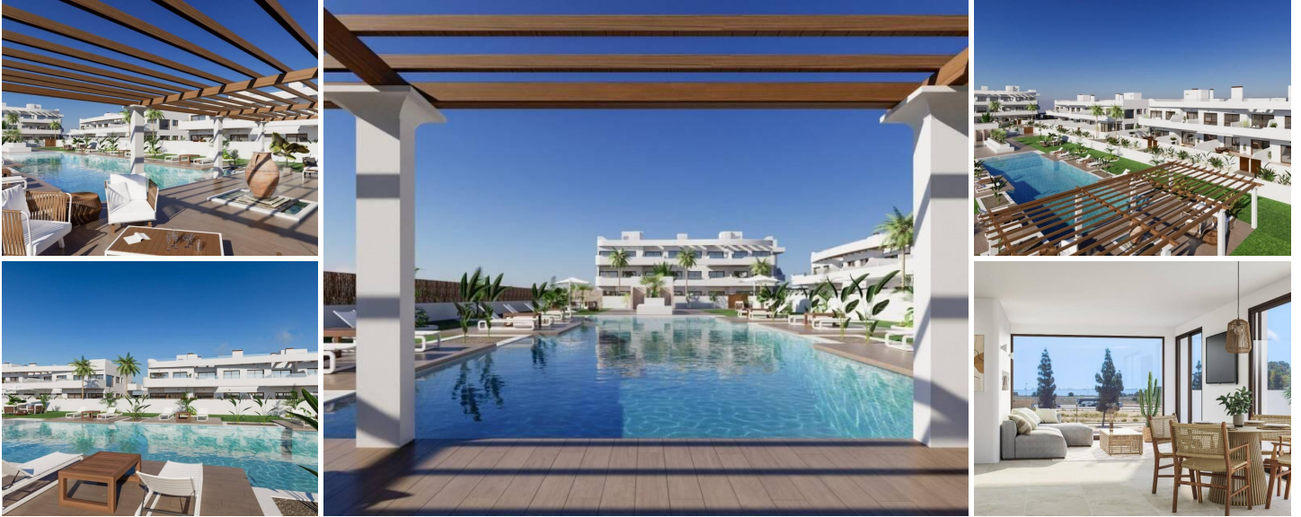
NEU GEBAUTE WOHNANLAGE IN LOS ALCAZARES

Wohnanlage in der idyllischen Umgebung von Los Alcázares an der schönen Costa Cálida.