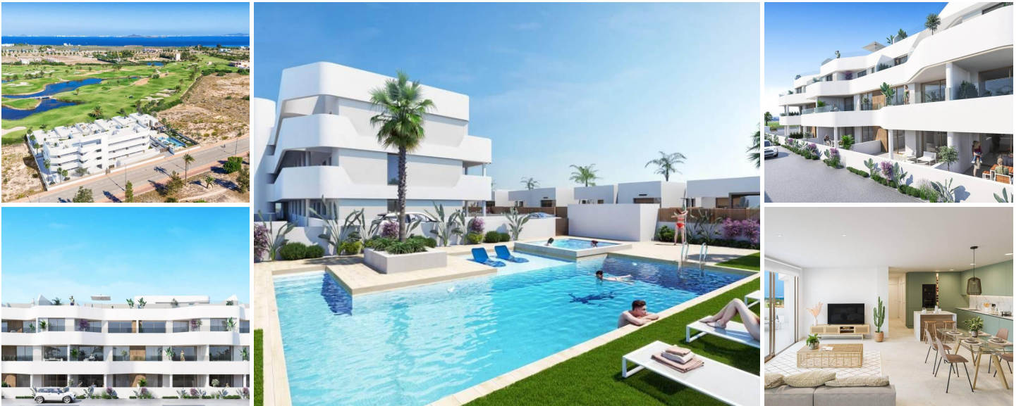
Neubau-Wohnanlage in Los Alcazares

Los Alcázares ist ein idyllischer Ort für diejenigen, die in eine neue Wohnimmobilie an der Costa Cálida investieren möchten. Nur 25 Minuten vom Flughafen Murcia und ca. 55 Minuten vom Flughafen Alicante entfernt, ist diese Gegend über die Autobahn bequem mit den großen Städten wie Cartagena, Murcia und Alicante sowie mit anderen schönen Stränden an der Costa Cálida und der Costa Blanca verbunden.