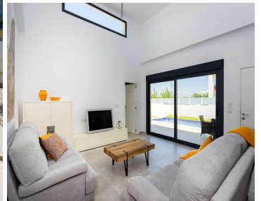
Neubau-Wohnanlage in Los Alcazares

Los Alcázares ist ein idyllischer Ort für diejenigen, die in eine neue Wohnimmobilie an der Costa Cálida investieren möchten. Nur 25 Minuten vom Flughafen Murcia und ca. 55 Minuten vom Flughafen Alicante entfernt, ist diese Gegend über die Autobahn bequem mit den großen Städten wie Cartagena, Murcia und Alicante sowie mit anderen schönen Stränden an der Costa Cálida und der Costa Blanca verbunden.