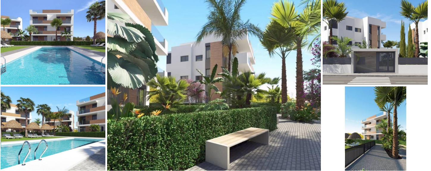
NEUBAU WOHNANLAGE IN LOS ALCAZARES