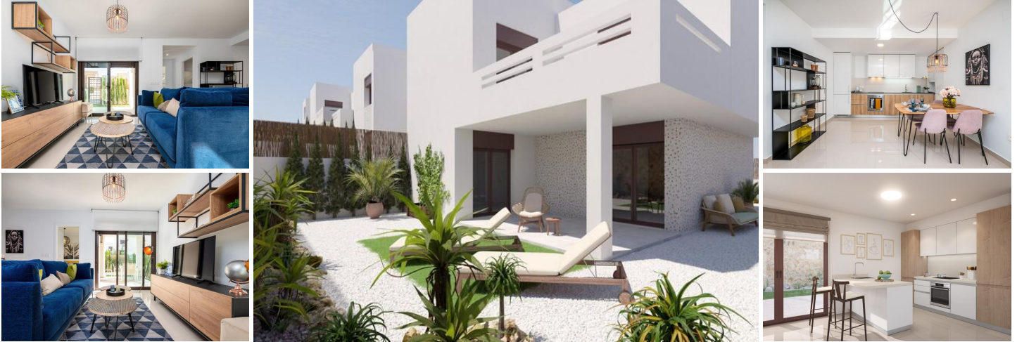
NEUBAU WOHNANLAGE IN LA FINCA GOLF

Neubau einer Wohnanlage mit Bungalowwohnungen und Reihenhäusern in La Finca Golf.