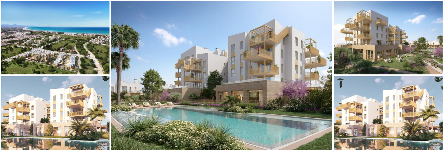
NEUBAU WOHNANLAGE IN EL VERGEL

Neubau eines Wohnkomplexes mit 65 modernen 2-Schlafzimmer-Apartments und 2 und 3-Schlafzimmer-Stadthäusern in El Verger.