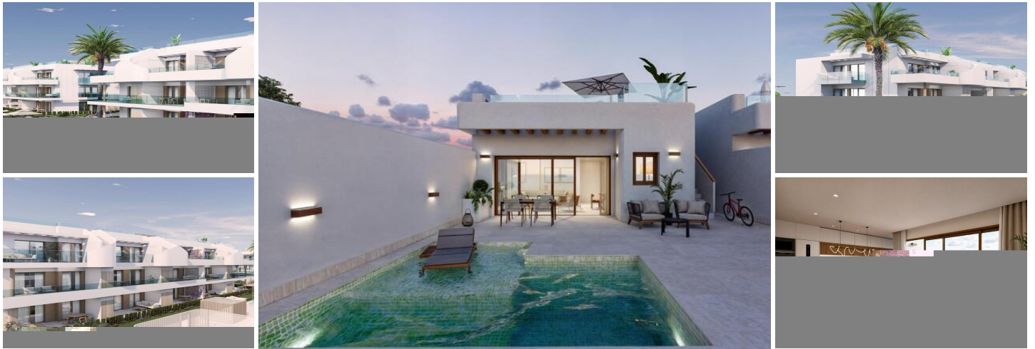
Moderne Neubau-Villen in Torre-Pacheco, Murcia

Entdecken Sie die perfekte Mischung aus modernem Design, Komfort und Lage mit diesen atemberaubenden Neubauvillen in Torre-Pacheco, Murcia.