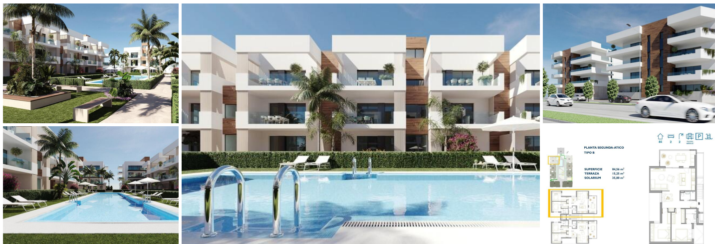
NEUBAU WOHNANLAGE IN SAN PEDRO DEL PINATAR

Neue Wohnanlage mit modernen Apartments und Penthäusern in San Pedro Del Pinatar.