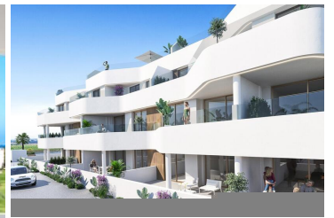
Neubau-Wohnanlage in Los Alcazares

Los Alcázares ist ein idyllischer Ort für diejenigen, die in eine neue Wohnimmobilie an der Costa Cálida investieren möchten. Nur 25 Minuten vom Flughafen Murcia und ca. 55 Minuten vom Flughafen Alicante entfernt, ist diese Gegend über die Autobahn bequem mit den großen Städten wie Cartagena, Murcia und Alicante sowie mit anderen schönen Stränden an der Costa Cálida und der Costa Blanca verbunden.