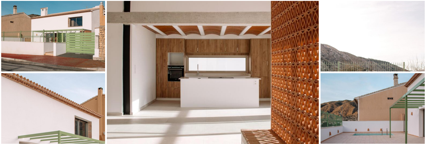
NEUGEBAUTE VILLA IN ORXETA

Neubau eines Einfamilienhauses in Orxeta, einer ruhigen Stadt in einem schönen und fruchtbaren Tal am Ufer des Flusses Sella und in der Nähe der Küste.