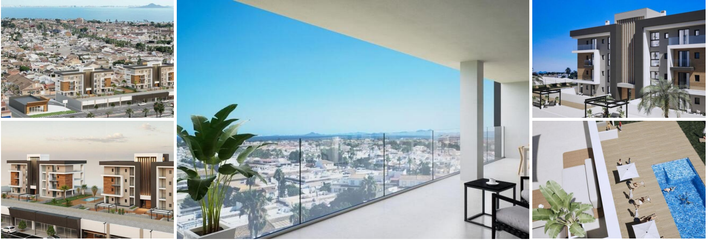
Touristische Wohnungen mit Mietlizenz in Los Narejos, Los Alcázares