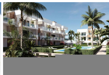
NEUBAU WOHNANLAGE IN SAN PEDRO DEL PINATAR

Neue Wohnanlage mit modernen Apartments und Penthäusern in San Pedro Del Pinatar.