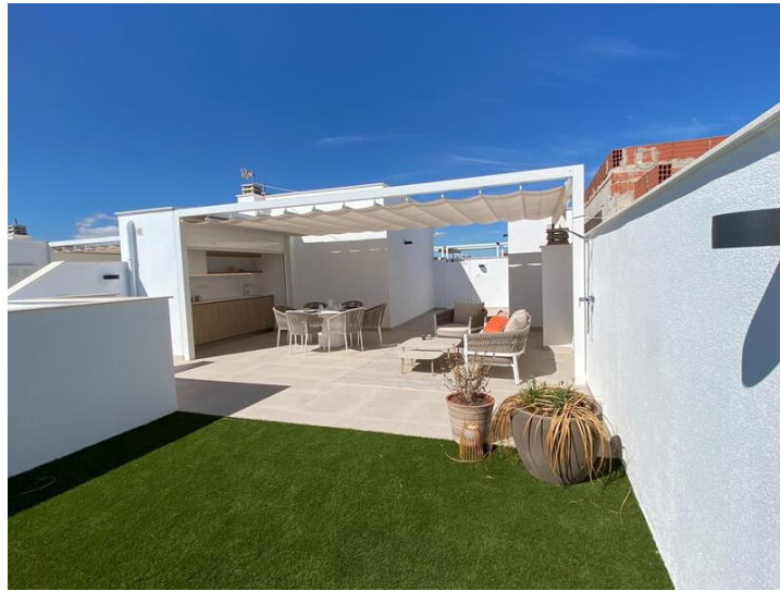
Neubau einer Bungalow-Wohnanlage in Pilar de la Horadada