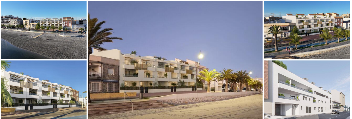
NEUBAU EINER WOHNANLAGE IN ERSTER LINIE IN SAN PEDRO DEL PINATAR

Lo Pagan liegt am bezaubernden Mar Menor und ist eine Stadt in Murcia, die eine nahtlose Mischung aus natürlicher Schönheit und kulturellem Reichtum bietet. Sie ist der perfekte Zufluchtsort für alle, die eine ruhige Oase suchen. Lo Pagan ist vom Flughafen Alicante aus in nur 57 Minuten zu erreichen und lädt dazu ein, sich in diesem idyllischen spanischen Küstenort zu entspannen, ihn zu erkunden und schöne Erinnerungen zu schaffen.