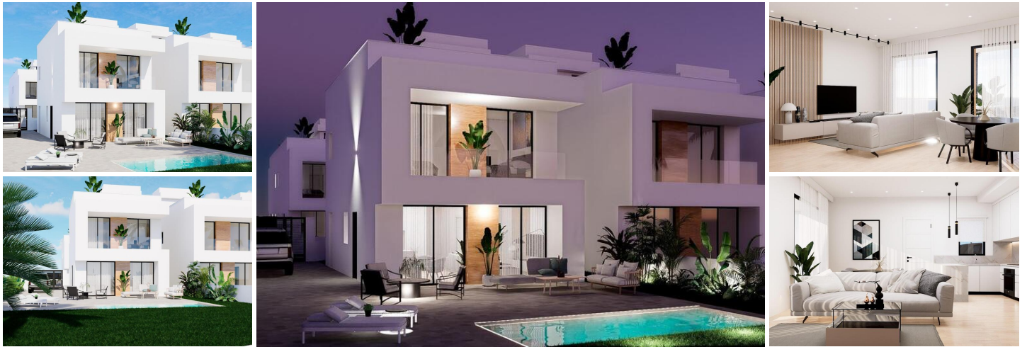
NEU GEBaute VILLEN IN LA ZENIA

Neubau von unabhängigen Villen und Doppelhaushälften in La Zenia, Orihuela Costa.