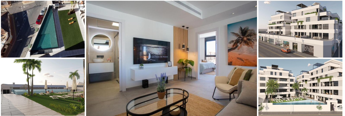
NEUBAU WOHNANLAGE IN SAN PEDRO DEL PINATAR

Neue Wohnanlage mit modernen Apartments und Penthäusern in San Pedro Del Pinatar.