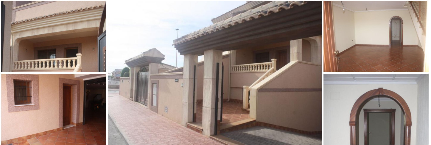
SCHÖNES STADTHAUS IN LOS ALTOS, TORREVIEJA

Schlüsselfertiges neues Stadthaus in Los Altos, nur wenige Minuten vom Krankenhaus von Torrevieja und dem rosa Salzsee entfernt.