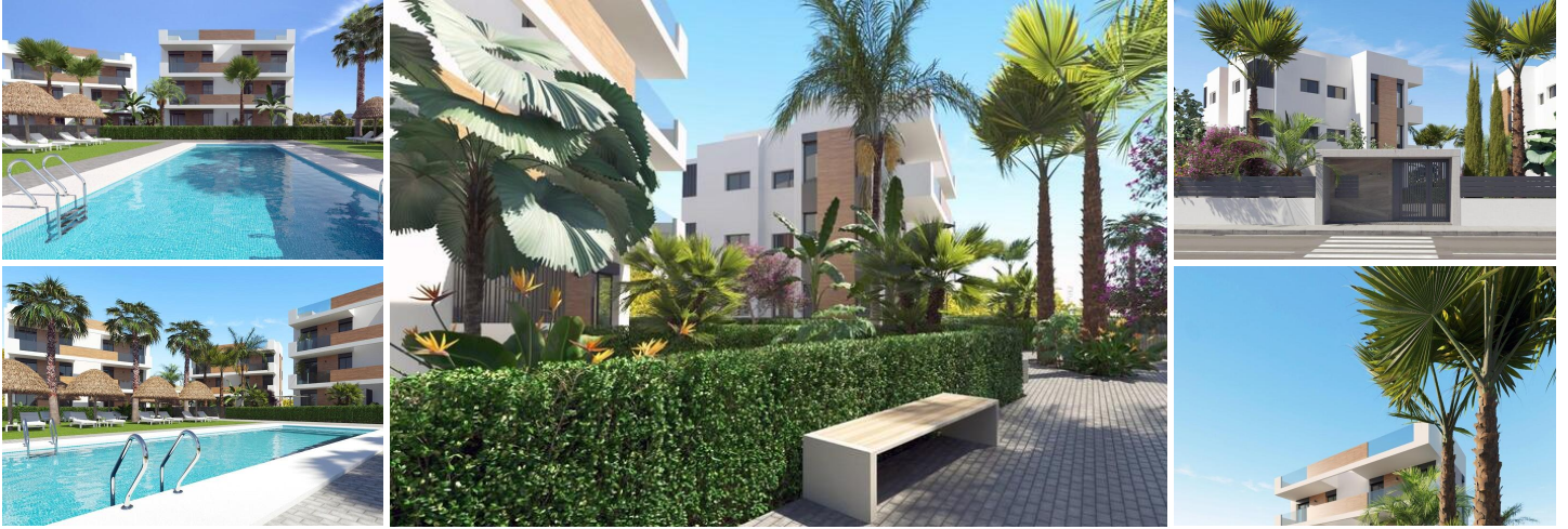
NEUBAU WOHNANLAGE IN LOS ALCAZARES