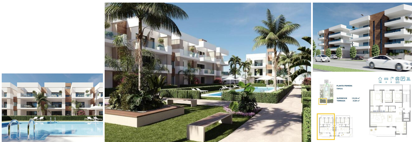
NEUBAU WOHNANLAGE IN SAN PEDRO DEL PINATAR

Neue Wohnanlage mit modernen Apartments und Penthäusern in San Pedro Del Pinatar.