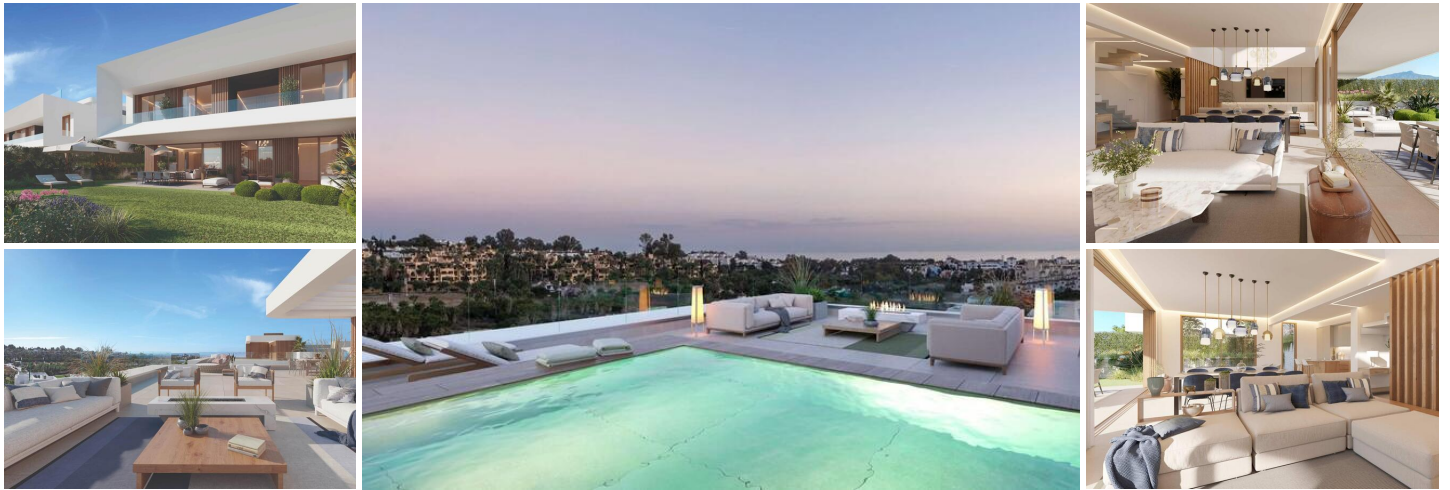
NEUGEBAUTE WOHNANLAGE IN EL PARAISO, MALAGA

Wenn Sie auf der Suche nach einem Ort sind, an dem Sie sich entspannen, die Sonne, die Gastronomie und Sport im Freien genießen können, dann sind Sie hier genau richtig. New Build Residence ist eine Boutique-Wohnanlage mit 15 modernen Häusern in der ruhigen Gegend von El Campanario, umgeben von Golfplätzen, ausgewählten Privatvillen und Luxusapartments. Der bezaubernde Golfplatz und das Clubhaus von El Campanario vervollständigen diese elegante Wohnanlage an der Neuen Goldenen Meile und sind ein wunderbarer Treffpunkt für ihre Bewohner. In der Umgebung befinden sich außerdem verschiedene Golfclubs - El Paraíso, Atalaya und Guadalmina - sowie Einkaufszentren mit allen erdenklichen Dienstleistungen.