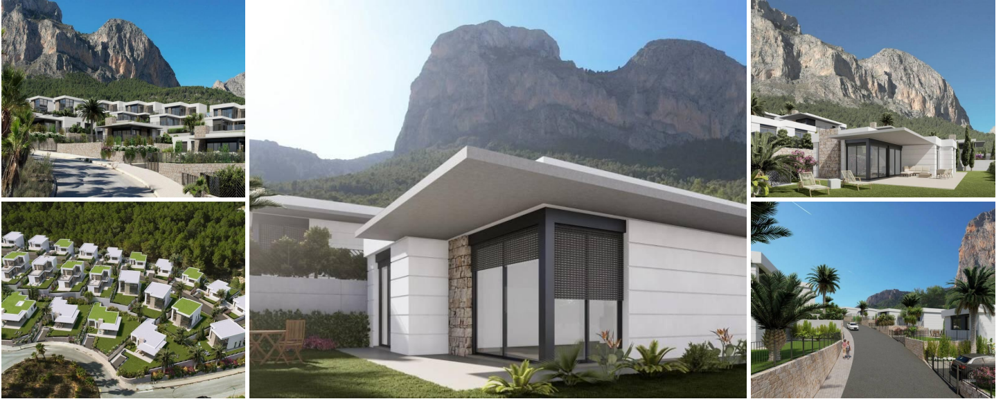
Neubau Villen in Polop, Alicante