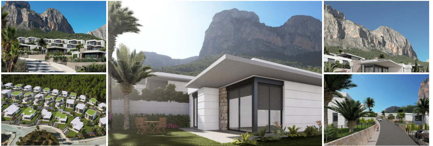
Neubau Villen in Polop, Alicante