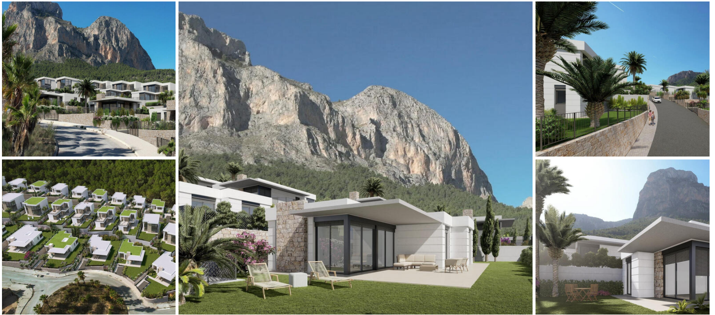
Neubau Villen in Polop, Alicante