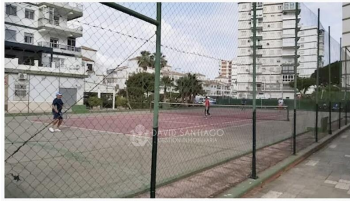
Pista de Tennis