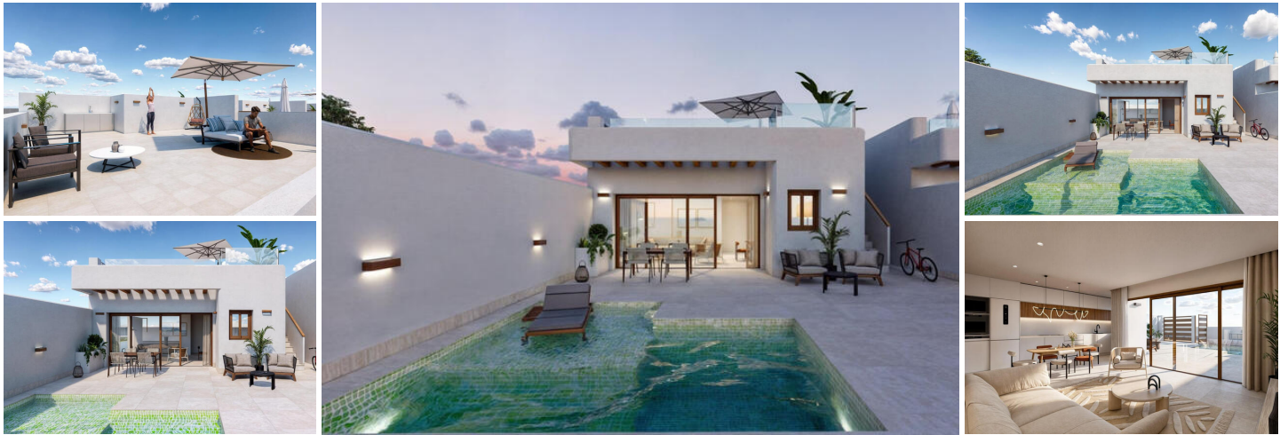
Moderne Neubau-Villen in Torre-Pacheco, Murcia

Entdecken Sie die perfekte Mischung aus modernem Design, Komfort und Lage mit diesen atemberaubenden Neubauvillen in Torre-Pacheco, Murcia.