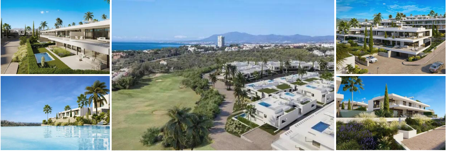
Moderne Luxus-Stadthaus mit Privatem Pool

Dieses elegante Stadthaus bietet 4 großzügige Schlafzimmer, 3 vollständige Badezimmer und 1 Gästetoilette sowie einen offenen Wohnbereich mit voll ausgestatteter Küche und separatem Hauswirtschaftsraum. Das Hauptschlafzimmer besticht durch ein eigenes Badezimmer und einen geräumigen begehbaren Kleiderschrank. Die Immobilie verfügt über 2 private Parkplätze und einen Abstellraum.