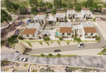
Neue Entwicklung von 7 Villen in La Nucía