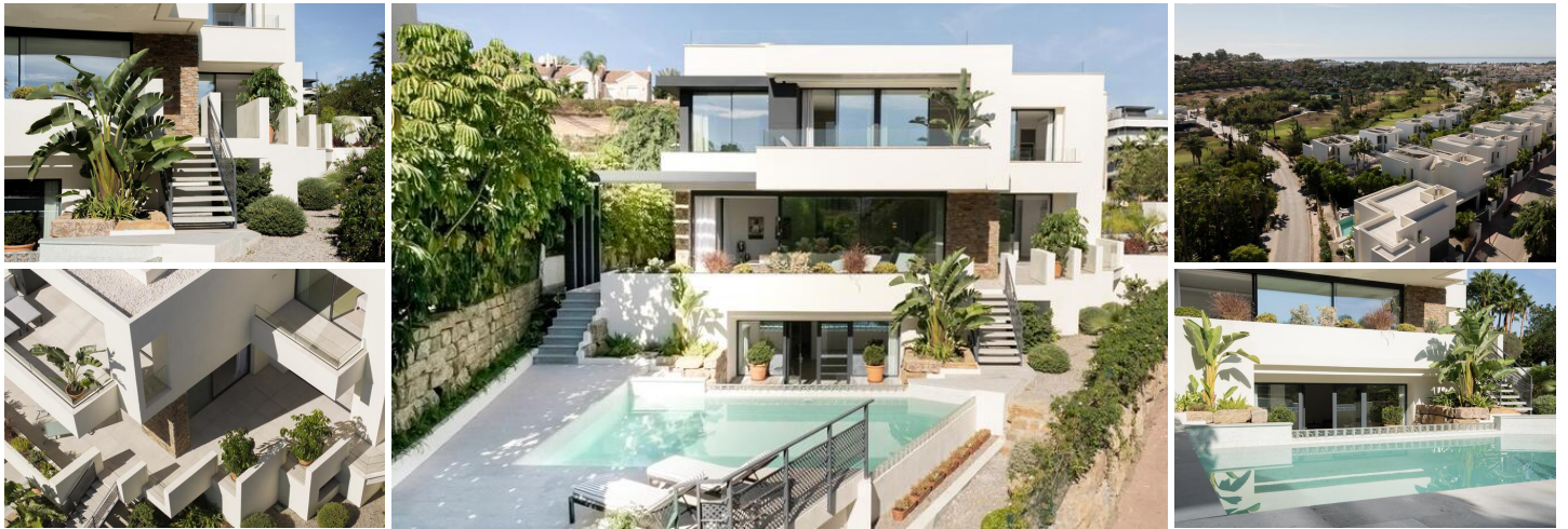
Moderne 4-Zimmer-Villa in El Campanario, Estepona Ost

Diese exquisite Villa verkörpert luxuriöses Wohnen an der Costa del Sol. Mit einer beeindruckenden Wohnfläche von 479 m 2 und einem großzügigen Grundstück von 649 m 2 bietet diese Immobilie die perfekte Kombination aus Raum, Privatsphäre und Eleganz. Exklusiv unter einem Sole-Agency-Vertrag gelistet, ist dies eine einzigartige Gelegenheit für anspruchsvolle Käufer, die ein bemerkenswertes Zuhause suchen.