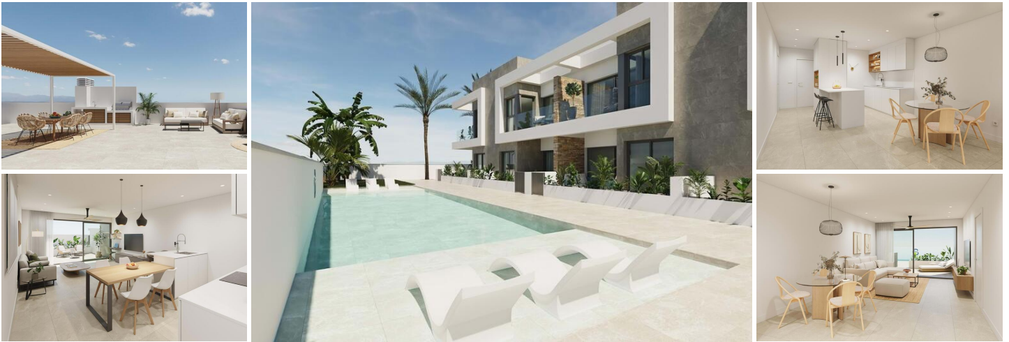
Moderne Wohnungen in Pilar de la Horadada - Exklusive Neubau-Wohnanlage

Entdecken Sie eine neue Wohnanlage mit 12 stilvollen Apartments und großzügigen Gemeinschaftsbereichen in der lebhaften Stadt Pilar de la Horadada an der Costa Blanca. Diese geschlossene Wohnanlage bietet moderne Annehmlichkeiten und ist so konzipiert, dass sie Komfort und Bequemlichkeit in einer erstklassigen Lage bietet, in der Nähe aller wichtigen Dienstleistungen und beliebten Attraktionen.