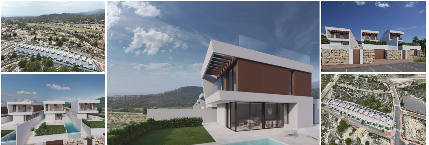
Moderne Villen zum Verkauf im Herzen der Costa Blanca, Alicante

Entdecken Sie eine atemberaubende neue Entwicklung von 14 modernen Villen in der Provinz Alicante an der schönen Costa Blanca. Eingebettet zwischen Benidorm, Finestrat und dem ikonischen Berg Puig Campana bieten diese Villen einen atemberaubenden Blick auf das Meer und befinden sich in der Nähe des neu entwickelten Golfplatzes Puig Campana. Mit einer kurzen 10-minütigen Fahrt zu einigen der prestigeträchtigsten Strände Spaniens bieten diese Immobilien einen unvergleichlichen Lebensstil in einer ruhigen und dennoch zugänglichen Umgebung.