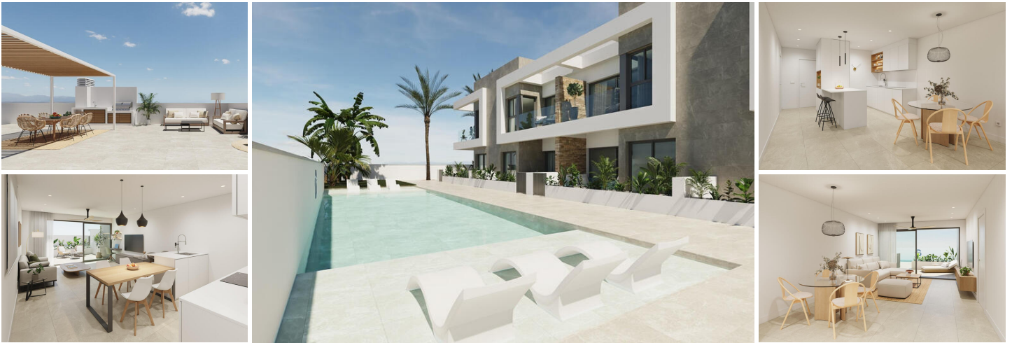
Moderne Wohnungen in Pilar de la Horadada - Exklusive Neubau-Wohnanlage

Entdecken Sie eine neue Wohnanlage mit 12 stilvollen Apartments und großzügigen Gemeinschaftsbereichen in der lebhaften Stadt Pilar de la Horadada an der Costa Blanca. Diese geschlossene Wohnanlage bietet moderne Annehmlichkeiten und ist so konzipiert, dass sie Komfort und Bequemlichkeit in einer erstklassigen Lage bietet, in der Nähe aller wichtigen Dienstleistungen und beliebten Attraktionen.