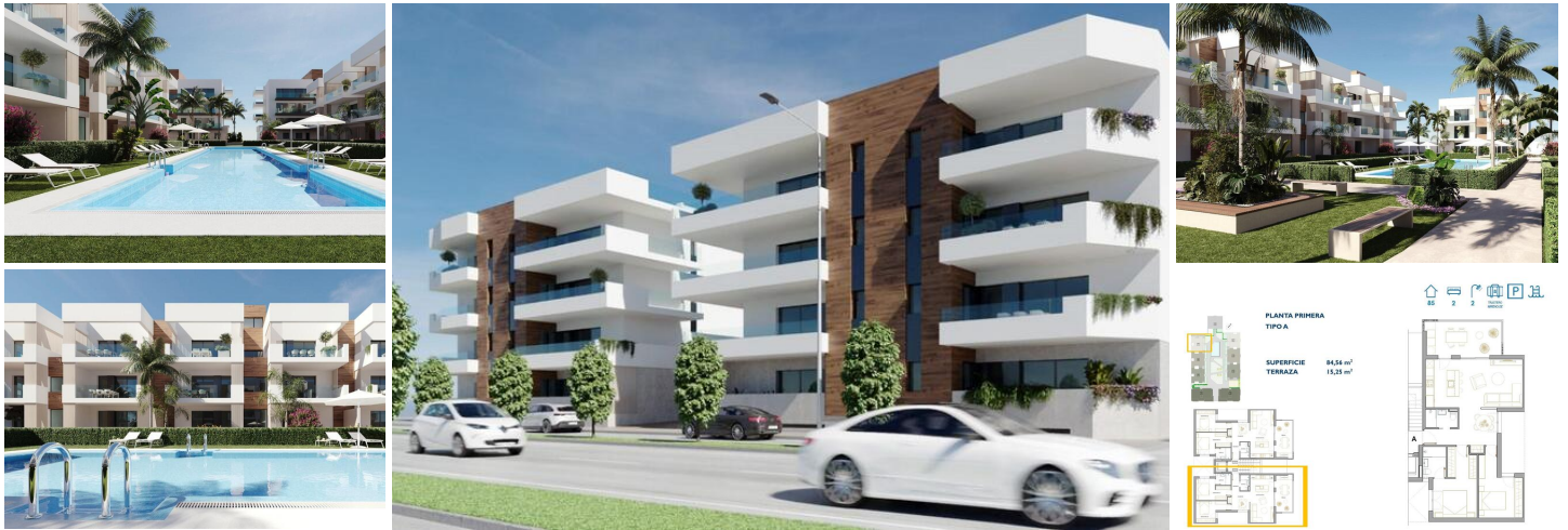
NEUBAU WOHNANLAGE IN SAN PEDRO DEL PINATAR

Neue Wohnanlage mit modernen Apartments und Penthäusern in San Pedro Del Pinatar.