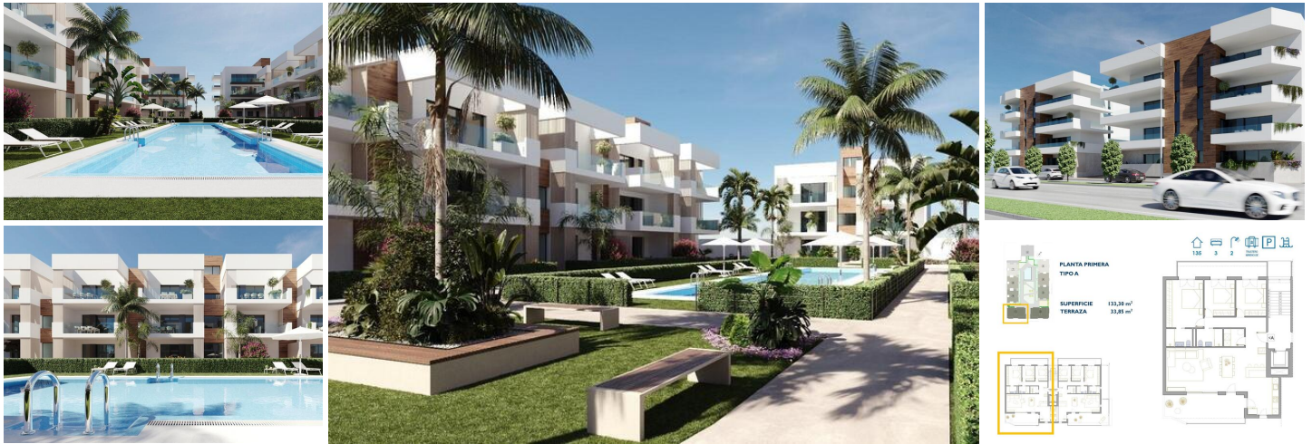
NEUBAU WOHNANLAGE IN SAN PEDRO DEL PINATAR

Neue Wohnanlage mit modernen Apartments und Penthäusern in San Pedro Del Pinatar.