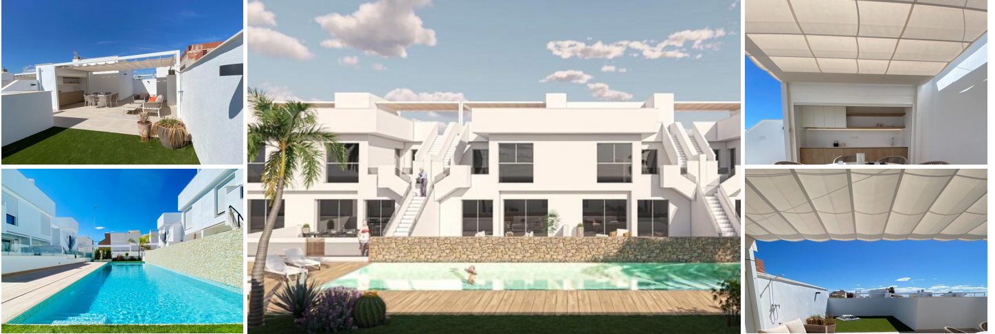
Neubau einer Bungalow-Wohnanlage in Pilar de la Horadada