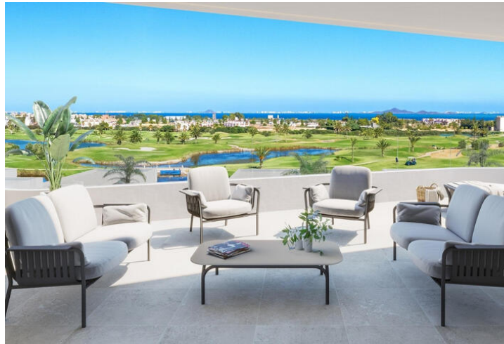
Neubau-Wohnanlage in Los Alcazares

Los Alcázares ist ein idyllischer Ort für diejenigen, die in eine neue Wohnimmobilie an der Costa Cálida investieren möchten. Nur 25 Minuten vom Flughafen Murcia und ca. 55 Minuten vom Flughafen Alicante entfernt, ist diese Gegend über die Autobahn bequem mit den großen Städten wie Cartagena, Murcia und Alicante sowie mit anderen schönen Stränden an der Costa Cálida und der Costa Blanca verbunden.