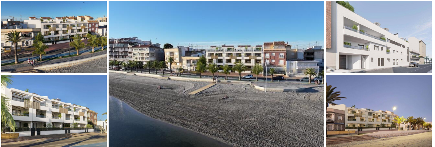
NEUBAU EINER WOHNANLAGE IN ERSTER LINIE IN SAN PEDRO DEL PINATAR

Lo Pagan liegt am bezaubernden Mar Menor und ist eine Stadt in Murcia, die eine nahtlose Mischung aus natürlicher Schönheit und kulturellem Reichtum bietet. Sie ist der perfekte Zufluchtsort für alle, die eine ruhige Oase suchen. Lo Pagan ist vom Flughafen Alicante aus in nur 57 Minuten zu erreichen und lädt dazu ein, sich in diesem idyllischen spanischen Küstenort zu entspannen, ihn zu erkunden und schöne Erinnerungen zu schaffen.