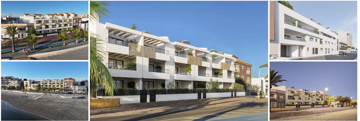
NEUBAU EINER WOHNANLAGE IN ERSTER LINIE IN SAN PEDRO DEL PINATAR

Lo Pagan liegt am bezaubernden Mar Menor und ist eine Stadt in Murcia, die eine nahtlose Mischung aus natürlicher Schönheit und kulturellem Reichtum bietet. Sie ist der perfekte Zufluchtsort für alle, die eine ruhige Oase suchen. Lo Pagan ist vom Flughafen Alicante aus in nur 57 Minuten zu erreichen und lädt dazu ein, sich in diesem idyllischen spanischen Küstenort zu entspannen, ihn zu erkunden und schöne Erinnerungen zu schaffen.