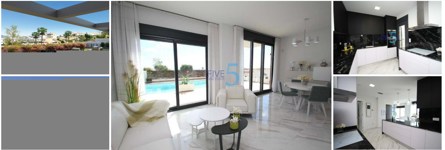
Neubauvilla in Orihuela Costa

Möchten Sie einen exklusiven Urlaub am Meer genießen? Unmöglich, nicht auf diese hochmoderne Villa in Orihuela Costa mit 2 Schlafzimmern, 2 Bädern, privatem Pool, Garten und luxuriösen Extras nach persönlichen Vorlieben hereinzufallen. Seine empfindliche Infrastruktur integriert sich in die Natur und bietet eine ruhige und isolierte Umgebung.