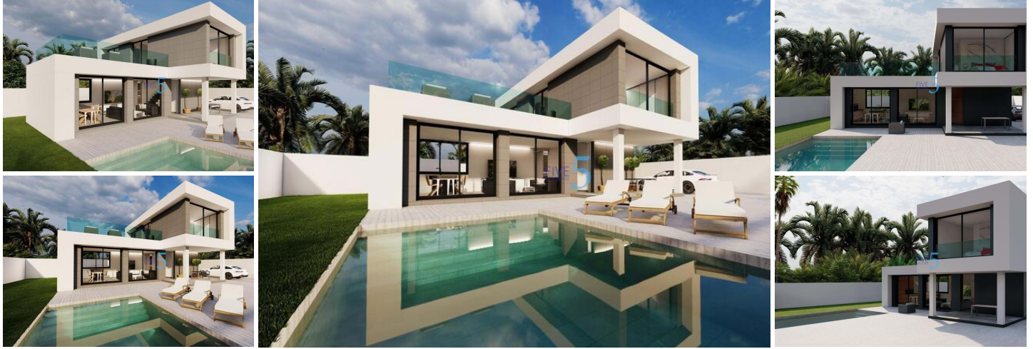
NEU GEBaute VILLA IN ROJALES

Neubau einer modernen Villa in Rojales in der Nähe aller Annehmlichkeiten und Dienstleistungen.