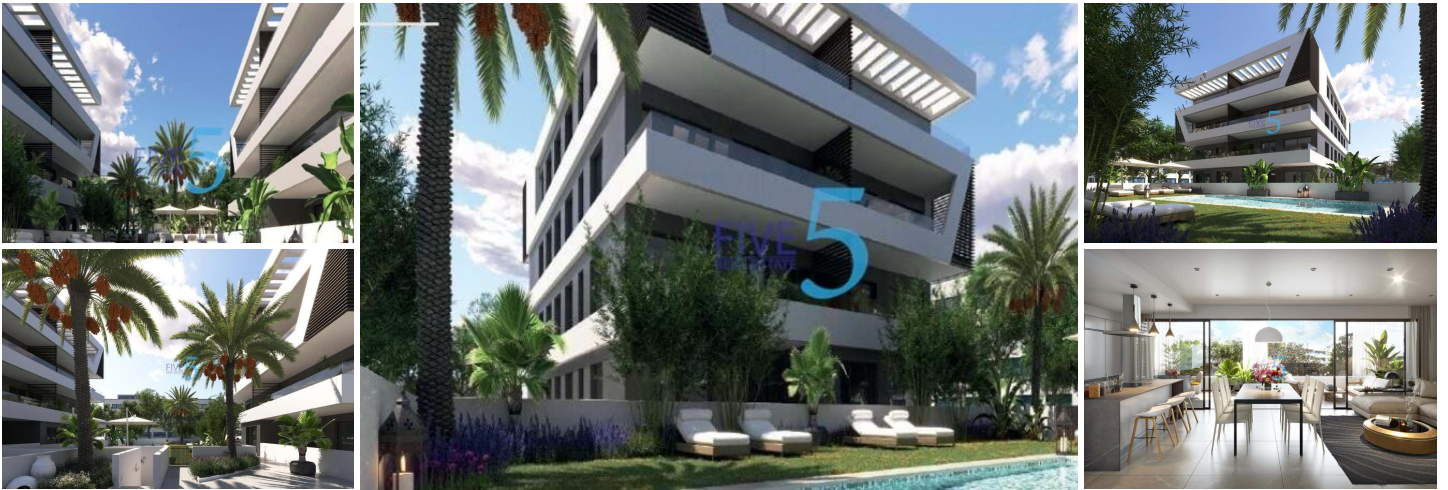
NEU GEBaute WOHNANLAGE IN SAN JUAN DE ALICANTE

Neubau-Wohnanlage mit 32 modernen Wohnungen und Penthäusern in der Gegend von Nou Nazareth in San Juan de Alicante.