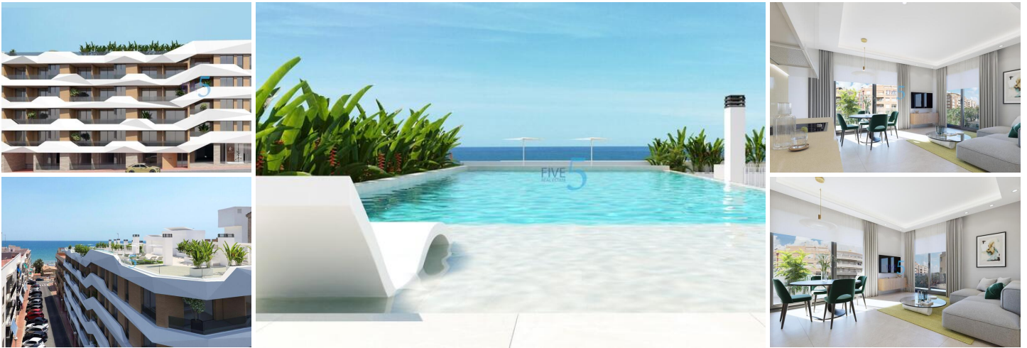
NEUBAU WOHNUNGEN IN GUARDAMAR DEL SEGURA

Neubau von Wohnungen und Penthäusern in Guardamar del Segura.